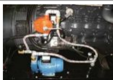
Kit travaso automatico carburante Automatic fuel transfer kit