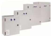
Quadro di commutazione automatica (ATS) da 160A 160A automatic transfer switch (ATS)