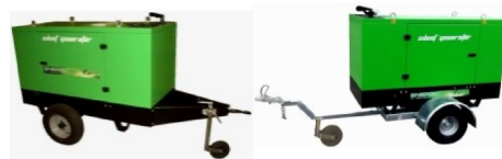
Carrelli di traino lento o veloce Slow or fast towing trailer