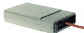
Preriscaldamento Engine preheating system